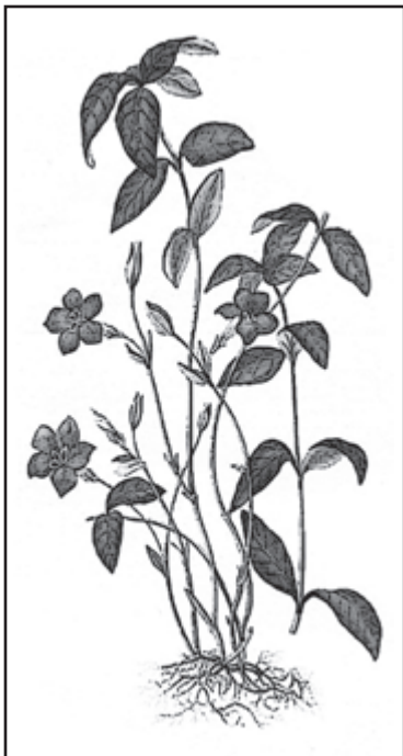
Télizöld meténg ( Vinca minor )

szászfű nem akárhol fordul elő, ezért ismerni kell az előfordulási helyét, ha éppen szükség van rá a gyógyításban. Ez a növény aránylag rövid szárú, évelő, kúszó félcserje, amely telepeken él, és ahol előfordul, gazdagon betakarja üde, zöld, fényes leveleivel a talajt. Az északos területeket kedveli, és erdőkben fordul elő. Régi köves kutakban is megtelepedett a kútgardán belül, ezért kútvirágnak is nevezték. A virága szép, élénk kék, szíromleveleinek széle kissé szögletes. A növény, igénytelensége és tetszetős örökzöld levelei miatt, a temetőkertekben is gyakori. A népi gyógyászat a leveleit, virágját hasznosította, és akkor gyűjtötték be, amikor épp szükség volt rá. Gyógyhatása tudományosan is megállapított; az optimális begyűjtési idő május és szeptember. Mivel fás szárú cserje, ezért sarlóval szokták levágni, árnyékos, szellős helyen kell szárítani. Gyakran előfordult, hogy az állatokon, disznón vagy fehér marhán kiütések jelentek meg, ilyenkor a szászfű teáját használták bekenő orvosságként. Jó adag növényi részt tettek kb. 4-5 liter vízbe, erős teát főztek, és ezzel naponta többször bekenték a beteg felületet, azaz lemosták vele. A művelet addig tartott, amíg a kiütések eltűntek.