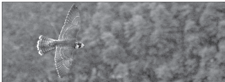
Șoimul călător a revenit ca specie cuibăritoare în România după mai mult de două decenii

Considerăm că este foarte importantă nedezvăluirea locurilor exacte de cuibărire a șoimilor, deoarece aceste informații, ajungând în posesia jefuitoarelor de cuiburi, pot aduce daune grave populației vulnerabile din țară, populație încă în revenire. ■