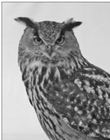
Buha este o specie cheie pentru desemnarea Ariilor de Protecție Specială Avifaunistică în România

Pe moment, ariile protejate, cu întindere mare din România, se află - cu excepția Rezervației Biosferei Deltei Dunării - în munți și ocupă numai 7,5% din teritoriul țării.