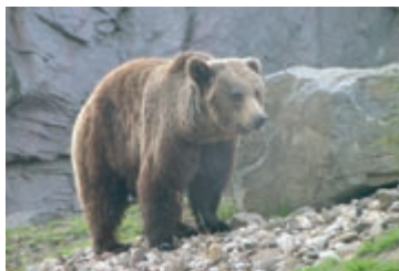
Ursul brun • Foto: Michael Joosten

iar celălalt în jurul unei livezi de suprafață mică, sau în jurul unui teren agricol)