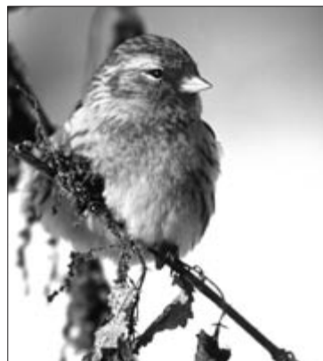
Mascul de înăriță • Foto: Kerekes István (AFIAP)

Pe baza observațiilor proprii și ale colegilor mei ornitologi, în perioada decembrie-februarie păsările au consumat mai ales semințe de urzică, coada șoricelului, brusture. În februarie unele exemplare