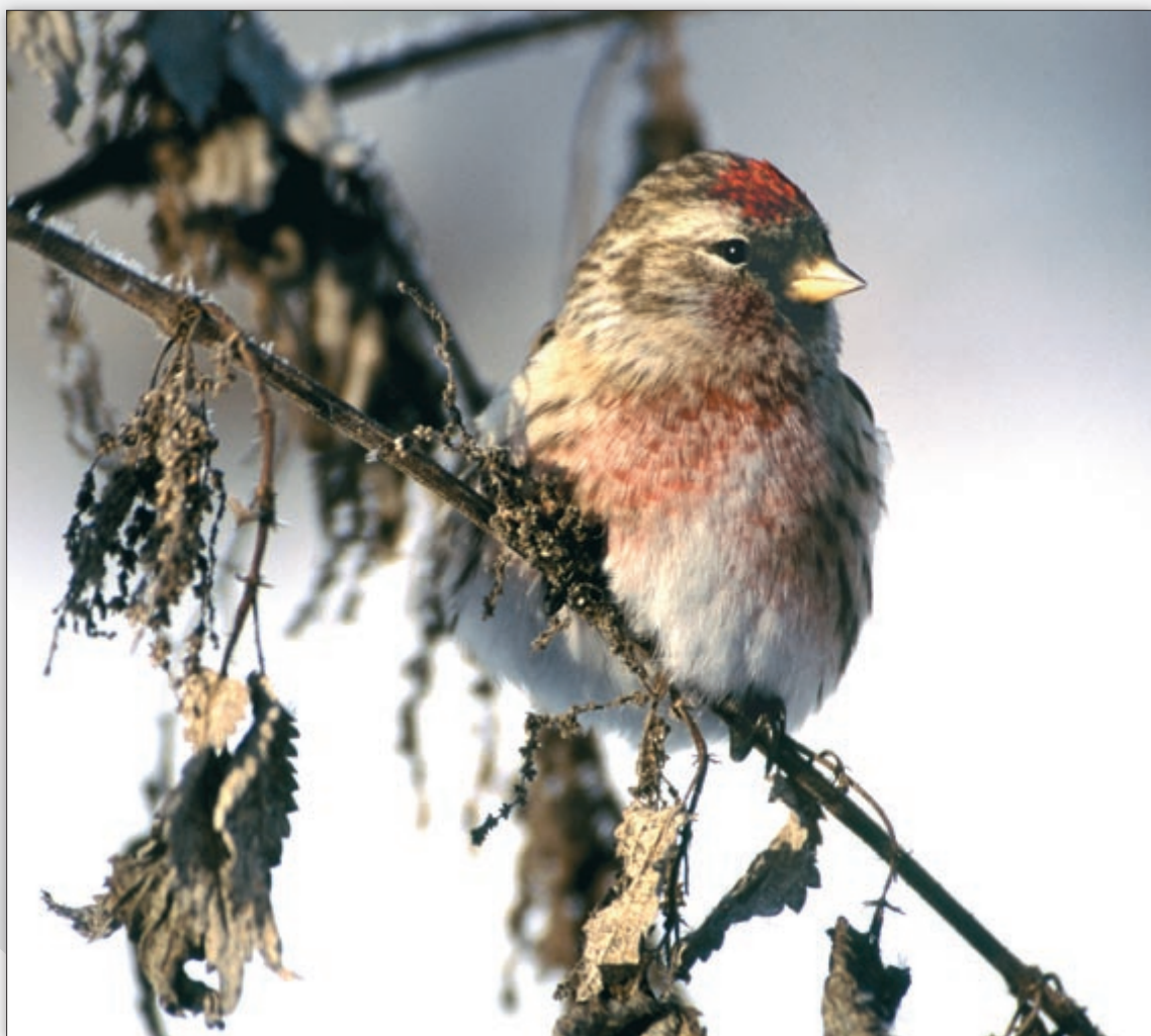
Mascul de inăriță