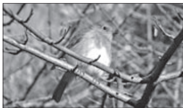
Măcăleandru a fost cea mai comună specie capturată în tabăra de inelare din Retezat

În timpul taberei am efectuat și observații faunistice, astfel am identificat 11 specii de mamifere, 50 de specii de păsări, 3 specii de reptile și 5 specii de amfibieni.