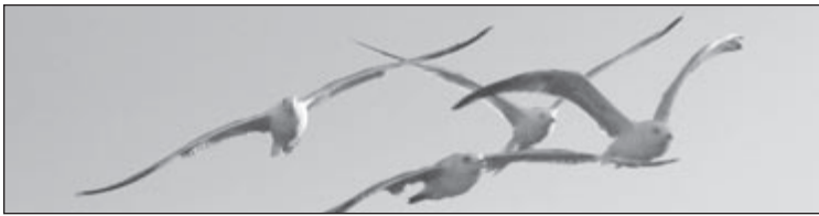
Pescărușul mediteranean specie cuibăritoare a orașului Tg.-Mureș

sului și, probabil, tot aceste păsări se hrăneau în vecinătatea brațului mort al Mureșului. Perechea a fost observată mereu împreună, până în 6 mai, după care numai una dintre ele își făcea apariția pe deasupra orașului, iar spre seară se așeza de regulă pe una dintre cele trei clădiri preferate de ea. În luna iunie am observat din nou, de câteva ori, ambele păsări zburând pe deasupra Tîrgu Mureșului. Aceste observații, devenite regulate, ne-au făcut să emitem ipoteza probabilității cuibăritului acestei specii undeva în zona centrală. Deși cuibul activ nu a fost identificat în acel an, aceste observații regulate și care acoperă aproape toată perioada de cuibărit a speciei, precum și observarea la 9 iulie a celor doi adulți însoțiți de doi pui proaspăt zburători, confirmă pentru prima dată cuibăritul pescărușului mediteranean ( Larus michahellis ) în zona Tg.-Mureș. Neavând posibilitatea de a urmări cu regularitate păsările, după această dată am mai observat împreună familia de patru ori, ultima dată fiind 18 august.