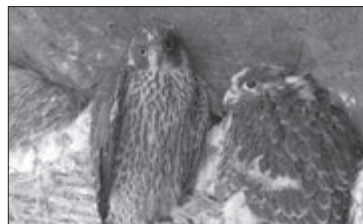
Deși în trecut șoimul călător a cuibărit și pe copaci, în prezent populația cuibărește aproape în exclusivitate pe stânci

În afara acestor date certe de cuibărire, avem și alte semnalări ale păsărilor adulte din timpul cuibăritului (pasăre adultă zburând cu hrană în direcția stâncilor). Au sporit observațiile păsărilor tinere, încă imature, în locuri prielnice pentru cuibărire. Păsările imature pot deja din al doilea an să-și ocupe și să apere teritoriul în care in-