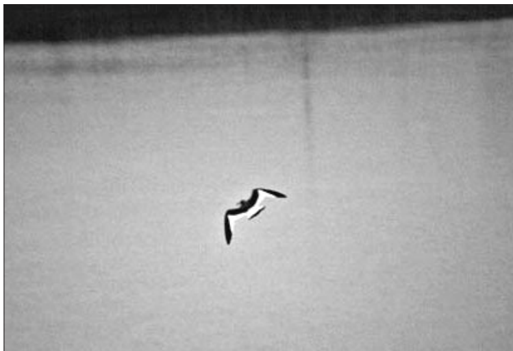
Unul dintre lacurile de la Cipău cu pescăruș cu coadă scobită

Pescăria Cipău poate fi accesată cel mai ușor de pe drumul județean spre Târnăveni, ramificat de pe șoseaua E60. La 300 m. după intersecție se virează la stânga, pe un drum de pământ, care ne duce exact la clădirile pescăriei. Se recomandă parcare mașinii înaintea barierei, și a le cere paznicilor drept de acces. În cursul anilor angajații pescăriei s-au obișnuit cu prezența păsărilor, și de obicei sunt înțelegători cu aceste „persoane ciudate”. Accesarea heleşteelor e posibilă și din alte direcții, totuși propunem prima variantă, celelalte nemulțumind de multe