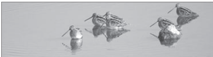
Becațina comună este o specie comună în timpul pasajului